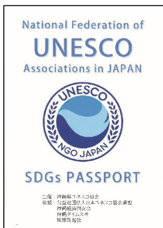
←パスポート表表紙

参加学生の皆さんには、ニュースレター等、本センターへ提供される沖縄ユネスコ協会からの情報をお送りしますので、本センターにおけるボランティア活動にとどまらず、広い視野を持った地域活動への学びに、つなげていただけたらと思います。